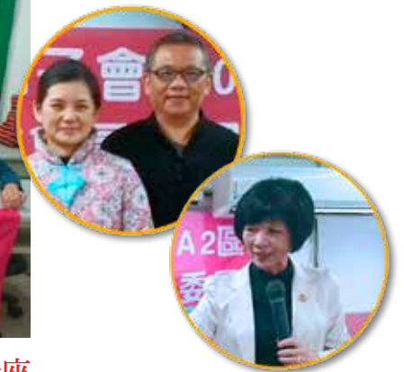
「做自己和別人生命中的天使——讓夢想起飛」公益講座