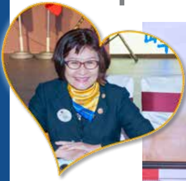
文 / 辦事處主任 黃美麗