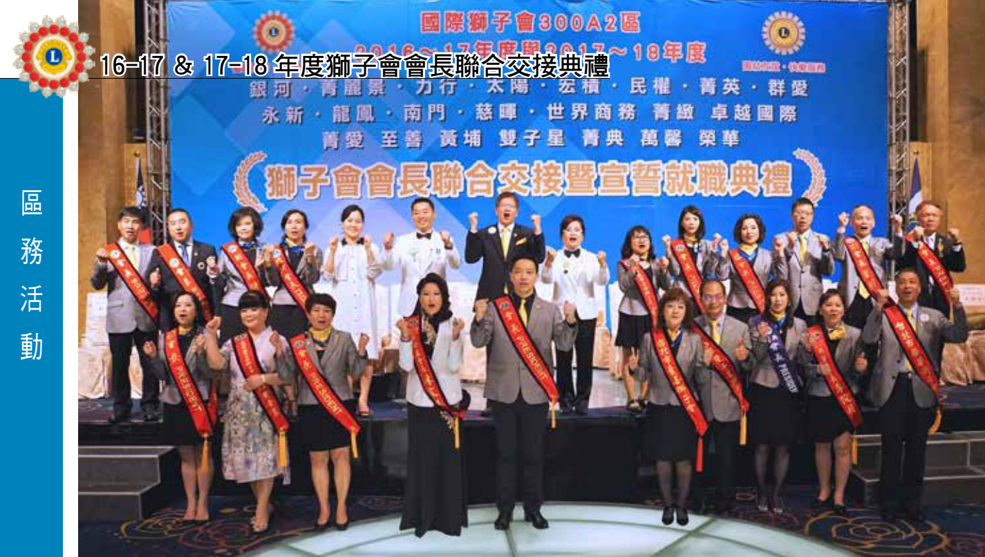
文 / 採訪副組長 陳阿興 圖 / 攝影組 程賢治・吳明輝