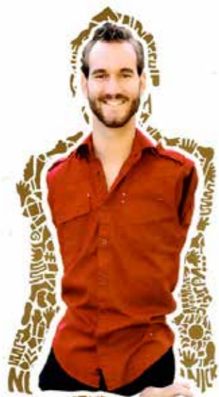
尼克·胡哲 NICK VUJICIC 我和世界不一樣

尼克·胡哲（Nick Vujicic）1982年12月4日生於澳洲，天生無手無腳，他曾被拒到正常學校上課、被同學奚落，甚至想自殺。不過，信主後他想通了，認定殘疾是「上天的禮物」。