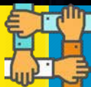
355-A (韓國釜山) 區